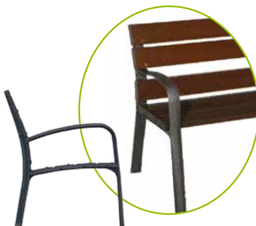
PIED MODERNE EN ACIER PEINT NOIR

Autre finition disponible : acier cintré galvanisé simple