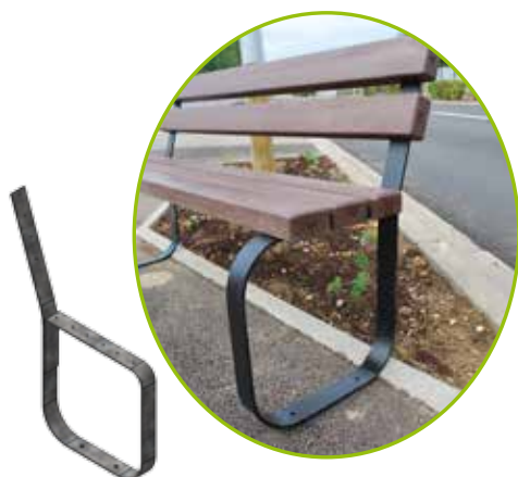
PIED EN ACIER CINTRÉ GALVANISÉ POWDRÉ NOIR

Hauteur totale banc : 800 mm Hauteur d'assise : 425 mm