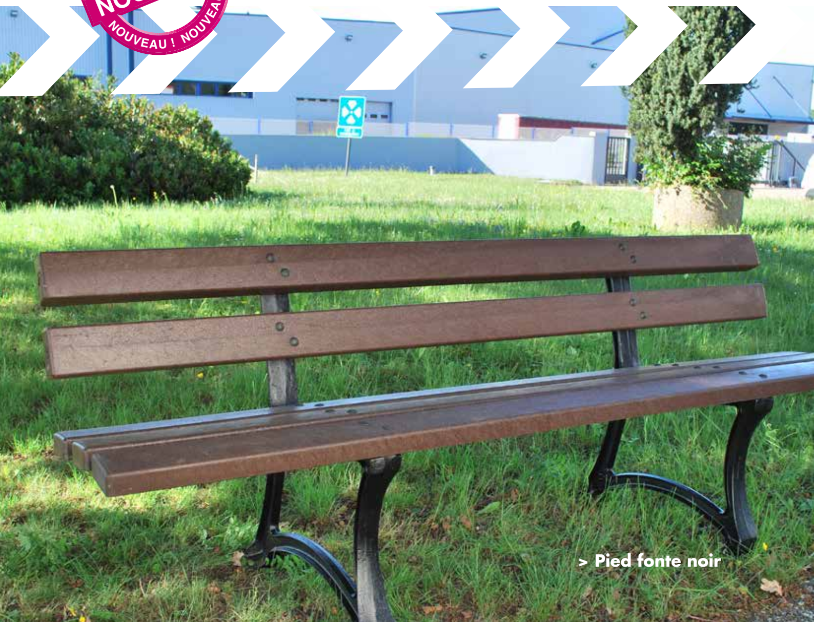
> Pied fonte noir