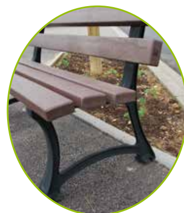
PIED EN FONTE PEINT NOIR

Hauteur totale banc : 840 mm Hauteur d'assise : 460 mm Hauteur accoudoir : 664 mm